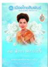
วารสารเดือนสิงหาคม 2560