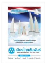
วารสารเดือนธันวาคม 2560

อบรมให้การศึกษาเกี่ยวกับสิ่งแวดล้อมและประกาศนโยบายด้านสิ่งแวดล้อมให้พนักงานได้ทราบทั่วกัน ผ่านทางช่องทางสื่อสารภายในองค์กร เช่น นิตยสารเมืองไทยสัมพันธ์ MTC, E-magazine และบริษัทส่งเสริม ปลูกจิตสำนึกในการใช้ทรัพยากรและพลังงานอย่างประหยัด พร้อมทั้งกระตุ้นและส่งเสริมให้พนักงานทุกคน ร่วมมือปฏิบัติอย่างจริงจัง ถือเป็นความรับผิดชอบของพนักงานทุกคนในการปฏิบัติงานที่มีผลต่อตนเอง, ต่อสังคม และองค์กร