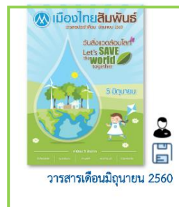
วารสารเดือนมิถุนายน 2560