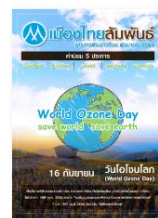
วารสารเดือนกันยายน 2560