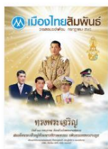
วารสารเดือนกรกฎาคม 2560