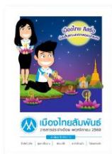
วารสารเดือนพฤศจิกายน 2560