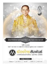
วารสารเดือนตุลาคม 2560