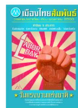
วารสารเดือนพฤษภาคม 2560